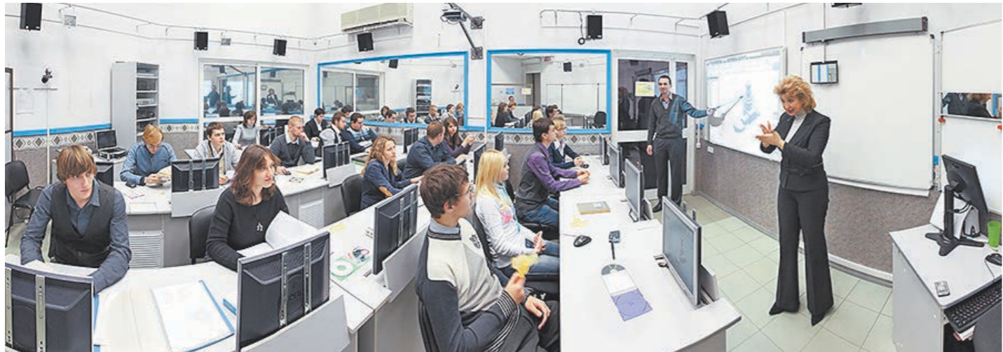
Идет занятие со слабослышащими студентами в Бауманке