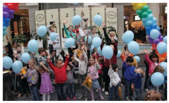
Радость без барьеров, для всех поровну

А мне вот кажется, что этот день запомнят не только те, ради и для кого был устроен этот праздник, но и совсем «посторонние», случайные зрители — молодые и пожилые, взрослые и ребяты, мамы и папы, дедушки и бабушки — все, кто замялся шагу у площадки с фонтаном. Потому что в самой атмосфере было что-то, объединяющее сердца; и ошумито, и наглядно срабатывал принцип «безбарьерной среды»: какие, помните, барьеры, когда здесь все — вместе, и вход для всех бесплатный, и радость — одна на всех и для каждого! Для взрослых и детей, для обычных и «особенных», для всех — по-разному.