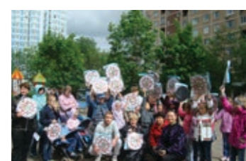
Праздник на свежем воздухе удался на славу

В начале июня в Центре реабилитации и досуговой работы с инвалидами «Братеево» состоялось немало веселых и добрых мероприятий, приуроченных ко Дню защиты детей. Задорными, азартными получились «Веселые старты», хотя погода в этот день была прохладная и не баловала нас солнцем, но ребята быстро согрелись в интересных спортивных соревнованиях, конкурсах и эстафетах. Здесь были и игры с мячом, и прыжки через скакалку, и соревнования с обручем. Все конкурсы проходили под аккомпанемент всеми известными и любимыми песен. Командный дух полностью захватил детей, каждый старался победить. Но проигравших не было, победила дружба. Никто не остался без подарка, что еще больше подняло настроение ребятим. И даже начавший накрапывать в конце праздника дождь не смог испортить впечатление детей от этого мероприятия. А на площадке во дворе филиала прошла арт-акция «Рисунки на асфальте». В этот день погода не подкачала — светило солнце и озаряло своим сиянием детские улыбки. В кон-