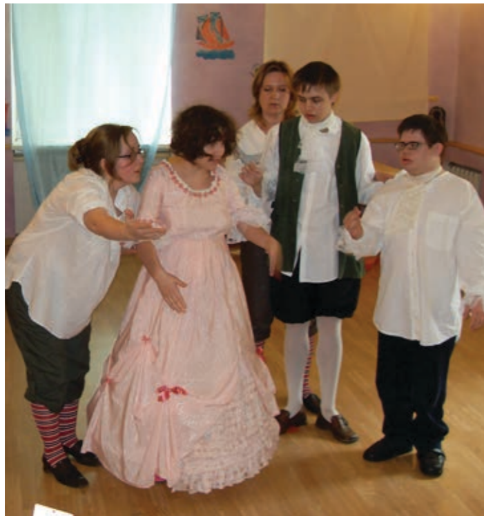
Идет школьный спектакль «Как царь Петр арапа женил»