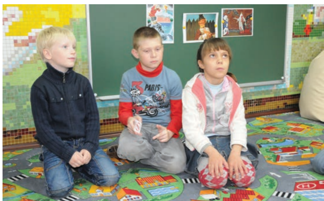
В социально-реабилитационном центре «Крюково» рады всем ребятам без исключений